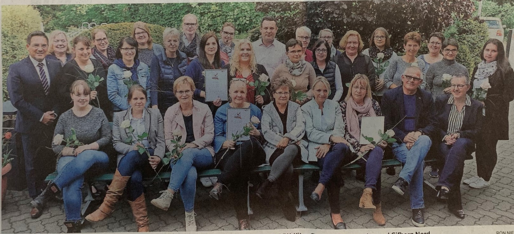
Ausgezeichnet: DRK-Präsidium und -Geschäftsführung freuen sich übers Gütesiegel für die DRK-Kitas Gamsen, Rosengarten und Gifhorn Nord.

Das Gütesiegel fußt auf den Niedersächsischen Orientie-